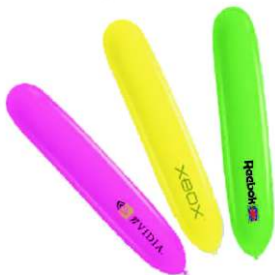
Ref.: 32P Globo Alargado 72 x 14 cm