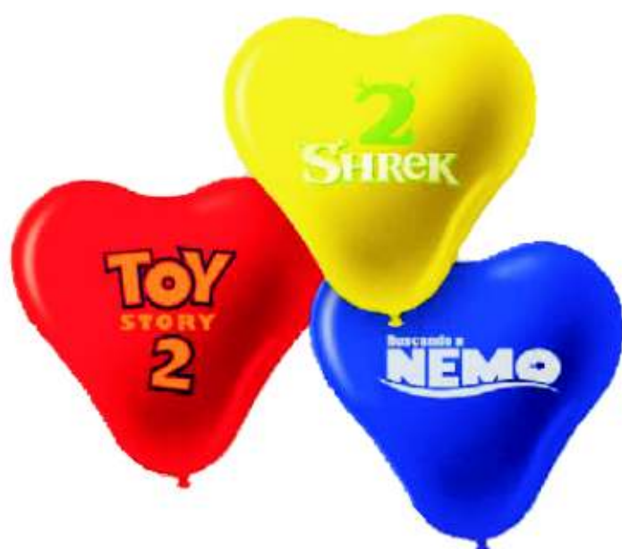
Ref.: 28P Globo Corazón 36 x 33 cm