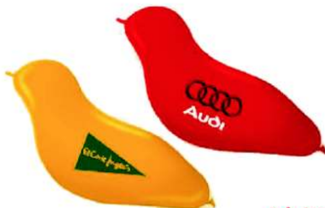
Ref.: 24P Globo Pájaro 80 x 23 cm