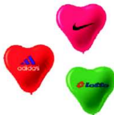
Ref.: 27P Globo Corazón Peq. 19 x 17 cm